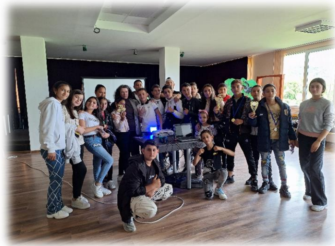
Кадри от кампанията в град Долна баня