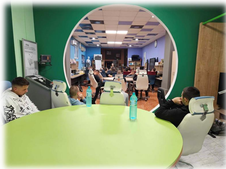
Кадри от кампанията в ПГ „Велизар Пеев“ - Своге