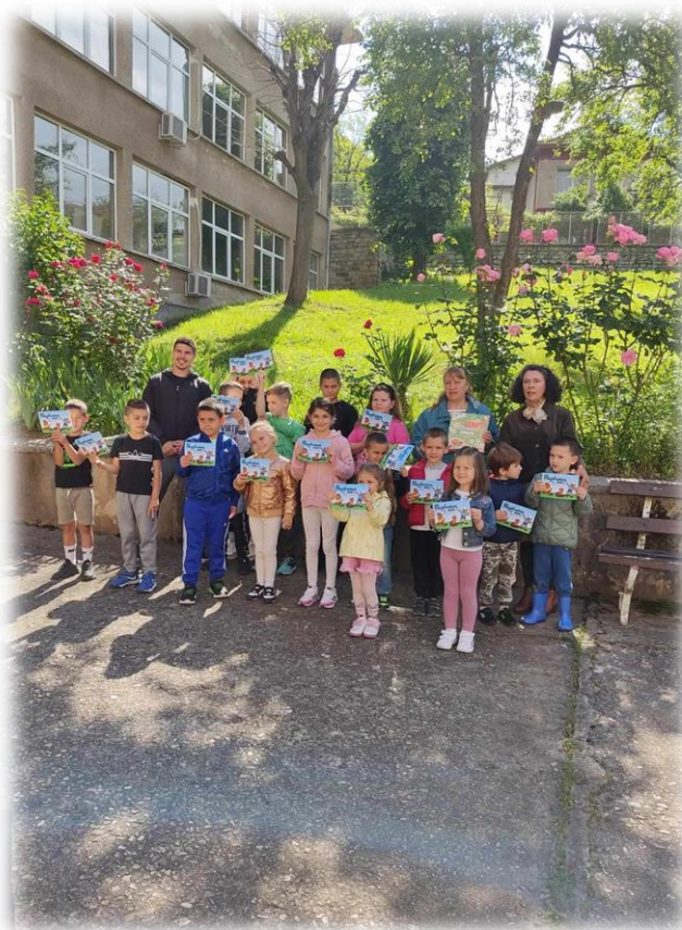
Кадри от кампанията в село Бов